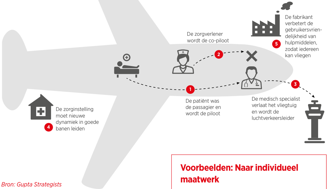
Figuur 1: Door digitalisering veranderen de rollen van patiënt, verpleegkundige en arts 2