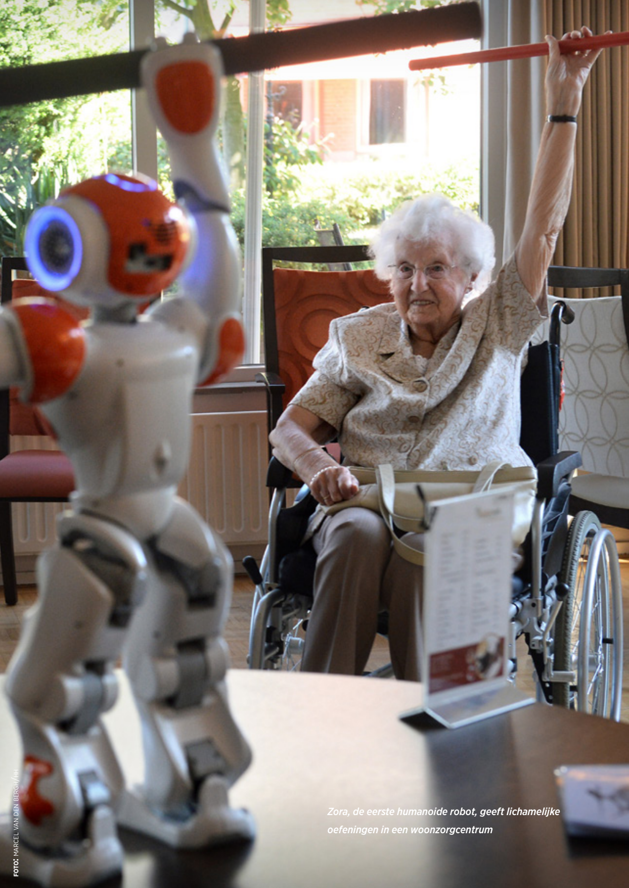
Zora, de eerste humanoïde robot, geeft lichamelijke oefeningen in een woonzorgcentrum